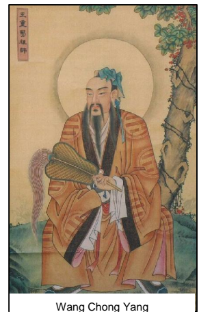
Wang Chong Yang

Ein „Unsterblicher“ ist im daoistischen Verständnis jemand der all seine körperlichen und geistigen Potentiale zur Entfaltung gebracht hat und so nicht nur zu einer tiefen Einsicht in