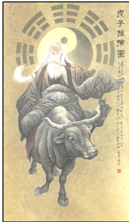
Laotse, Legendarer Begründer des Daoismus und Verfasser des Daodejing

Die großen philosophischen Klassiker des Daoismus, wie das Daodejing, umreißen die Lehre vom Dao und seiner Wirkkraft De, geben uns jedoch so gut wie keine praktischen Anleitungen zum Beschreiten dieses Weges.